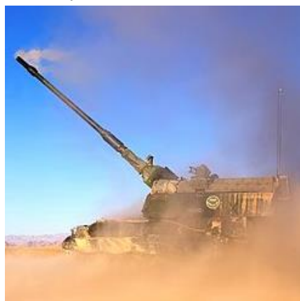
Nederlandse PzH 2000 vuurt op Taliban in Chora op 16 juni 2007.

De Luitenant-generaal b.d. Hans van Griensven was in 2007 commandant van de Task Force in Uruzgan, Afghanistan. Hij gaf daar leiding aan ca 1400 Nederlandse en 600 Australische militairen in het kader van de ISAF missie van de NAVO. Deze periode is veel in het nieuws geweest vanwege de discussie in Nederland over 'opbouwmissie' versus 'vechtmissie' en de zogenaamde slag om Chora, die