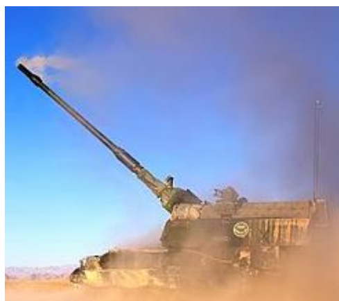
Nederlandse PzH 2000 vuurt op Taliban in Chora op 16 juni 2007.

gevechtsactie waar Nederlandse militairen bij betrokken waren sinds de oorlog in Korea. Momenteel is Afghanistan weer volop in het nieuws wegens de recente ontwikkelingen na het terugtrekken van de internationale presentie in het land en de nog lopende rechtszaak, waarin een aantal Afghanen de Nederlandse staat aanklagen wegens de burger slachtoffers die zijn gevallen bij de slag om Chora. De generaal van Griensven zal uit eerste hand toelichten hoe in zijn periode de missie werd ingevuld, de omstandigheden rond de slag om Chora schetsen en zal kunnen ingaan op vragen die er momenteel leven rond de meest recente ontwikkelingen. In zijn ogen was de missie zeker niet zinloos.