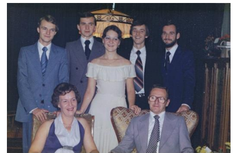
Het gezin bij het zilveren huwelijk in 1977