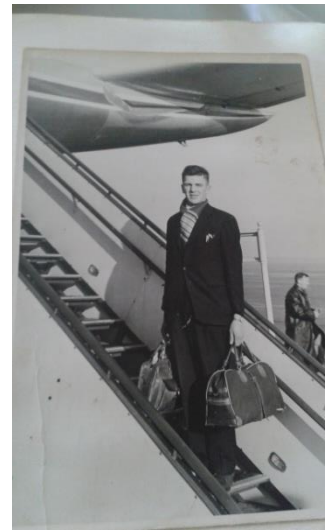
Vertrek in burger.

briek Gulden Vlies in Hilvarenbeek en Agio in Duizel voor een weekgeld van wel 13 keiharde Nederlandse guldens! Daarna een tijdje, samen met zijn vader en vier broers, bij de Philipsglasfabriek. Maar dan roept het vaderland, lichter 60-4, Regiment Infanterie Oranje Gelderland is zijn deel. Krijgt meteen 'de boodschap' dat hij zal worden uitgezonden naar Nieuw-Guinea. Een op- of aanmerking daarover zoals: "Mijn ouders zullen dat niet goed vinden, ze kunnen mij niet missen" of "die zullen zeker niet tekenen e.d." zijn tegen dovemansoren gezegd. Ze worden weggewuifd met de dan geldende oplossing: "desnoods tekent de generaal zelf wel die toestemming..." Daar kan hij het meedoen, en dus, na een grondige tropenopleiding in o.a. Maastricht, Roermond en Oirschot tot mortierschutter, is hij klaar voor vertrek.